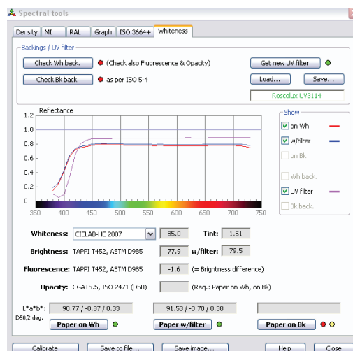
Фиг.1 (Ляво) - Изследване на бяла и черна подложка